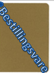
2862-40 mayagold *