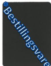
17H8-10 mattgraudunkel = NCS S 8000 N