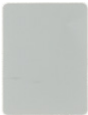
1723-20 lichtgrau * = RAL 7035