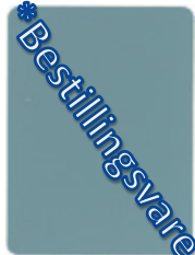
1684-20 pastellturkis * = RAL 6034