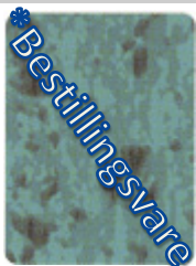
3602-20 patina 2