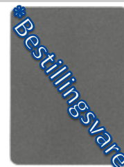
2984-20 titancolor *