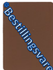
1802-20 kaffeebraun = RAL 8024