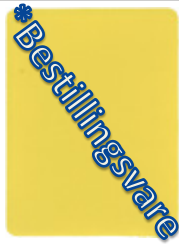
1143-20 Zinkgelb * = RAL 1018