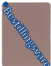
1407-20 altstadrosenholzrosa* = NCS S 4010R10B