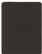
1809-20 eloxalbraun = NCS S8005Y50R