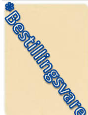
1122-20 hellelfenbein * = RAL 1015