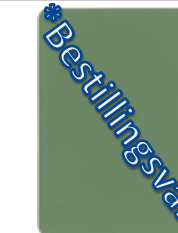
1624-20 graugr6n* = RAL 6021