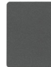
2947-20 normgraualuminium = RAL 9007