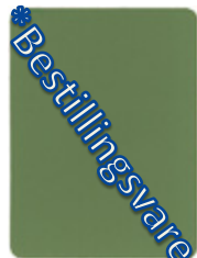
1602-20 resedagr6n = RAL 6011