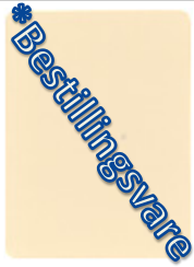
1934-20 perleweiss = RAL 1013