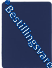
1521-20 enzianblau * = NCS S 5040R90B