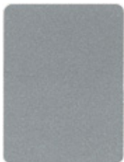
2923-40 brillianmetallic = RAL 9006