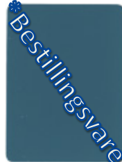
1555-20 turkisblau * = RAL 5018