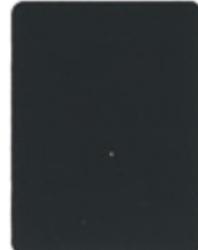
1729-20 anthrazit-grau = RAL 7016