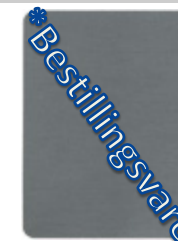
2981-80 Klarlack abwitternd (Colour group 0)

Ovenstående leveres som falzonal aluminium. Ønskes andre RAL farver, kan vi lakere profilerne, dette medføre dog en længere leveringstid på ca. 1 uge.