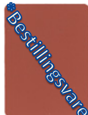
1324-20 altstadrot* = NSC S 4040Y90R