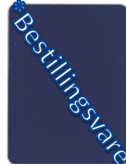
1502-20 azurblau =RAL 5009