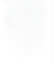
1997-20 normreinweiss = RAL 9010