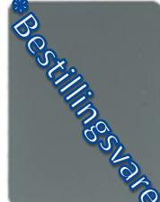
17K2-10 matthellzink = NCS S 5005B20G