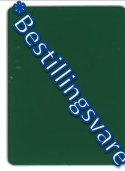
1678-20 normminzgrun * = RAL 6029