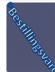
1504-20 taubenblau = RAL 5014